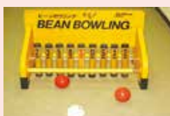
ビーンボウリング