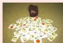
スキヤキ・ジャンケンゲーム

レクリエーショングッズの他に、車いす、ポータブルトイレなどの福祉機器用具も貸し出しております。