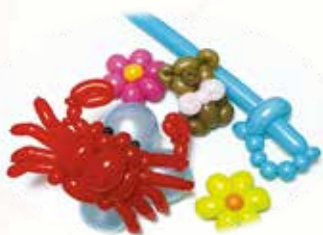
バルーン プレゼント