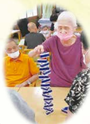
レクリエーション 体験