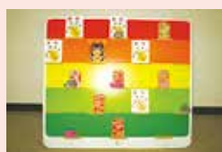
開運お手玉ボード