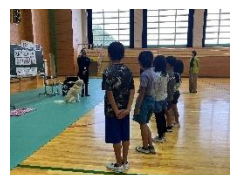
介助犬体験(照来小学校) (ボランティア協力校指定業)