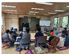
歌長ふれあいサロン開設 (いきいきサロン助成事業)