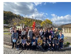
ひとり暮らし高齢者のつどい