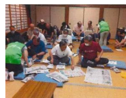
新温泉防災リーダーの会 (減災・防災啓発事業)