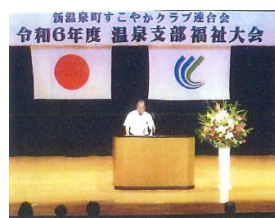
福祉大会(温泉支部) (すこやかクラブ連合会)