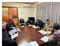
塩山ささえあいマップ作り(塩山) (地域福祉推進事業)