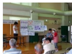
研修会と会員のつどい (身体障がい者福祉協会)