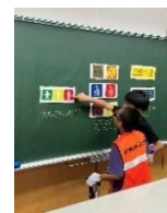
高齢者疑似体験 (温泉小学校)